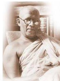
අතිපූජ්‍ය වැලිවිටියේ ශ්‍රී සෝරත නාහිමිපාණේ (විද්‍යාදාය විශ්වවිද්‍යාලයේ නිර්මාතෘ)