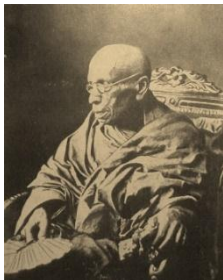
අතිපූජ්‍ය හික්කඩුවේ ශ්‍රී සුමංගල නාහිමිපාණේ (විද්‍යාදාය පිරිවෙනේ නිර්මාතෘ)

The Faculty of Humanities and Social Sciences is committed to the development of the community and the nation at large through the dissemination and enhancement of knowledge enriched with the country's cultural heritage.